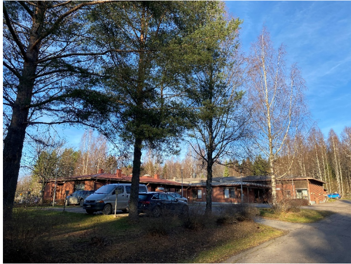
Liike- ja toimistorakennus suunnittelualan länsipuolella Keskisenkadulla.

Suunnittelualan ulkopuolella lähiympäristössä sijaitsevia rakennuksia: