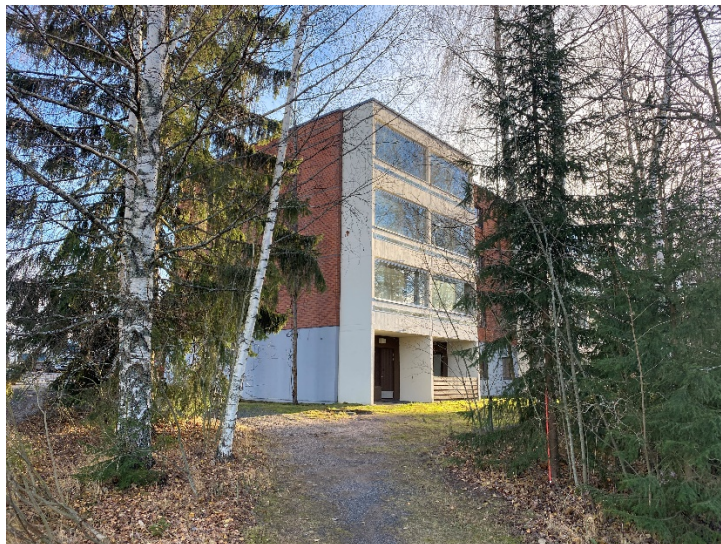
Asuinkerrostalo Vanhan Tampereentien pohjoispuolella.

Suunnittelualueelta ei ole tiedossa erityisiä kulttuuriympäristöarvoja. Alueelta ei ole myöskään tiedossa arkeologisia kohteita eikä alueeseen liity selvitystarpeita.