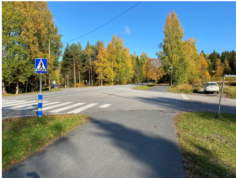
Sisääntulotien ja Pilvilinnankadun risteysaluetta.

Suunnittelualue on taajaman rakennettua liikennealuetta, jota reunustaa paikka paikoin istutetut puurivit. Alueeseen ei kohdistu erityisiä maisema-arvoja. Suunnittelualueen lähiympäristössä sijaitsee puustoisia lähivirkistysalueita.