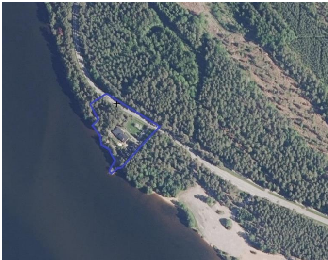
Suunnittelualueen likimääräinen rajaus osoitettu sinisellä.

Suunnittelualueen likimääräinen rajaus ilmakuvassa: