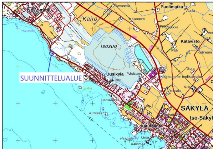
Kartta: Maanmittauslaitoksen maastokartta.

Suunnittelualueen suurpiirteinen sijainti kartalla: