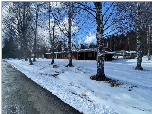
Suunnittelualueelle johtaa Marskinkatu. Kuva kaakosta.