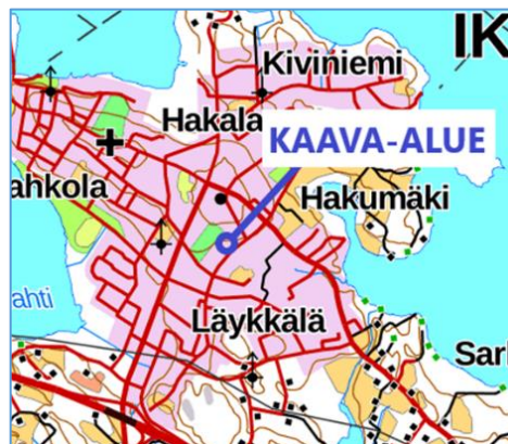
Kaava-alueen ohjeellinen sijainti.

Suunnittelualue sijaitsee Ikaalisissa Hakumäen (6) kaupunginosassa, noin kilometrin päässä Ikaalisten keskustan palveluista kaakkoon.