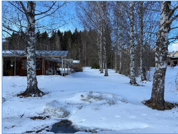
Korttelia 4 on kaavamuutoksessa tarkoitus laajentaa voimassa olevan asemakaavan mukaiselle puistoalueelle, jossa on tällä hetkellä puustutuksia. Kuva etelästä.