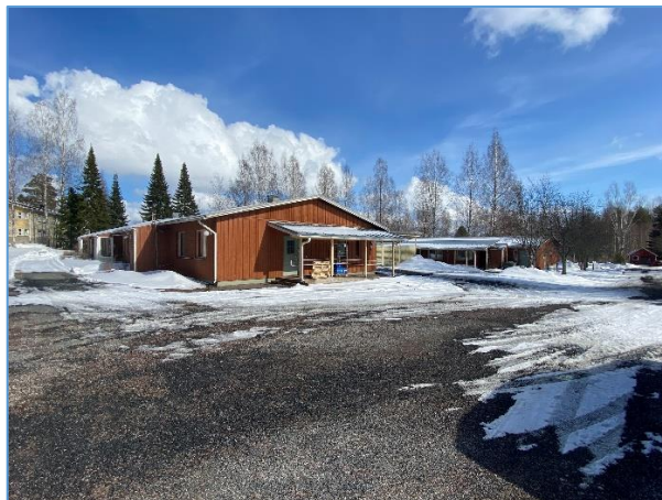
Suunnittelualaue luoteesta kuvattuna.

Suunnittelualaueelta ei ole tiedossa rakennetun ympäristön arvohteita tai muinaisjännöksiä.