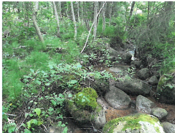
Kuvat: Kairolammen rantaluhtaa ja alueen keskivaiheen noropainanne.

Käenmäentien varrella on vanhan saha-alueen kohdalla peltoalue (7), jota niitetään kesäisin. Pelto ei ole kehittynyt niittymäiseksi, vaan siellä kasvaa lähinnä eri heiniä. Käenmäentien risteyksessä on myös pienialainen rantametsikkö (8), joka on hyvin kulttuurilajivaikutteinen hopeapajuineen. Lajistosta voidaan mainita pietaryrtti, sarjakeltano, siankärsämö, vuohenputki, koiranputki, maitohorsma, pujo ja pelto-ohdake. Kevyenliikenteen väylän ja Käenmäentien väliin jää myös pienialainen kolmio, joka on pajujen ja koivun valtaama. Kuivemmalla tiepenkalla kasvaa kuitenkin joitakin kuivan niitty lajeja kuten päivänkakkara, siankärsämö, harakankello, huopakeltano, pukinjuuri, pietaryrtti ja särmäkuisma. Valtalajit kolmiossa ovat kuitenkin lupiini, pujo, vuohenputki ja voikukka.